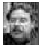
Του Λούι Ηγουμενίδη

Η έκρηξη στο Μαρί, η διερεύνηση και οι ανακρίσεις, «οι προσδοκώμενες ευθύνες», οι εκδηλώσεις των «αγανακτισμένων» και το μέτωπο της οικονομίας κυριαρχούν στο πολιτικό και κοινωνικό προσκήνιο, έχοντας ως κοινό παρονομαστή το «ενδιαφέρον» για την εξουσία και τις προεδρικές του 2013. Ο Πρόεδρος, η Κυβέρνηση και το ΑΚΕΛ παλεύουν για να διατηρήσουν τις πιθανότητες τους να βρίσκονται στην πλευρά των κυβερνήσεων, με τον ένα ή τον άλλο τρόπο, και μετά το 2013, η δε αντι-