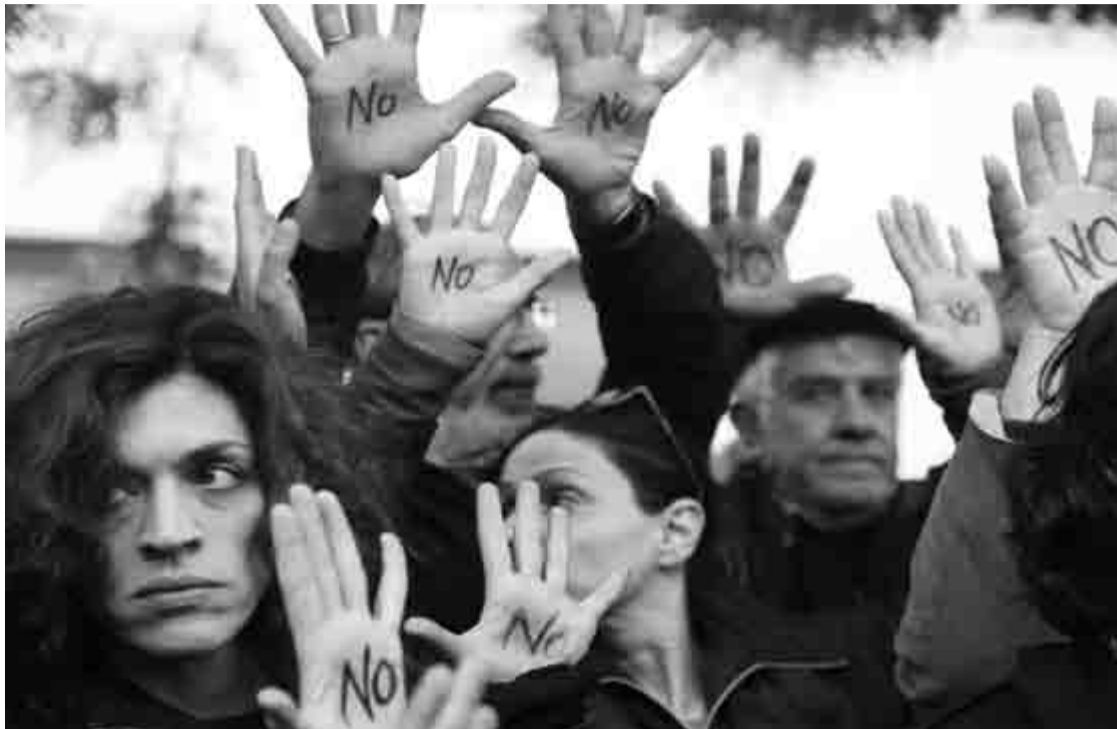
Έξω από τη Βουλή, που παρεμπιπτόντως ήταν κλειστή, συγκεντρώθηκαν χθες το απόγευμα πολίτες, οργισμένοι και σφόδρα δυσαρεστημένοι από την απόφαση του Eurogroup να επιβληθεί τέλος στις καταθέσεις.

Οι διαδηλωτές, δεν έμειναν στη Βουλή για πολλή ώρα. Κατευθύνθηκαν και προς το προεδρικό, όπου έμειναν όπως με πληροφόρησαν κάμποση ώρα. Προφανώς θα είχαν πληροφορηθεί για τη μεγάλη σύσκεψη υπουργών και οικονομικών παραγόντων που έλαβε χώρα χθες υπό την προεδρία του Νίκου Αναστασιάδη και ήθελαν να κάνουν αισθητή την παρουσία και τη διαφωνία τους. Άλλωστε, η Βουλή όταν συγκεντρώθηκαν εκεί είχε κλείσει, αφού η ολομέλεια που έχει προγραμματιστεί για χθες αναβλήθηκε και θα πραγματοποιηθεί σήμερα το απόγευμα. Να σας πω επίσης ότι οι διαδηλωτές πηγαίνοντας προς το προεδρικό πέρασαν από τη γερμανική πρεσβεία. Ανέβηκαν μάλιστα στην ταράτσα του κτιρίου και κατέβασαν τη γερμανική σημαία από τον ιστό της και την πέταξαν