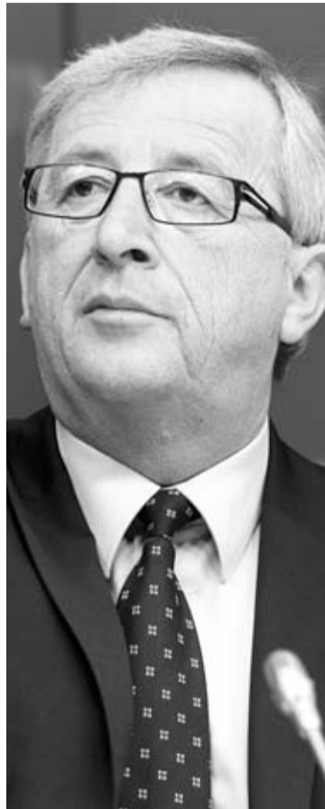
Η καγκελάρια της Γερμανίας, Άγκελα Μέρκελ, ο πρόεδρος της Κομισιόν, Ζοζέ Μπαρόσο και ο πρόεδρος του Eurogroup, πρωθυπουργός του Λουξεμβούργου, Ζαν Κλοντ Γιούνκερ θα είναι στις 11 Ιανουαρίου στην Κύπρο για να λάβουν μέρος στη σύνοδο κορυφής του ΕΛΚ, που διοργανώνει ο Δημοκρατικός Συναγερμός.