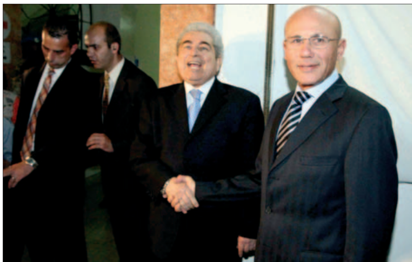
«Η μη λύση δεν είναι λύση. Η διχοτόμηση ισούται με καταστροφή», έστειλε το μήνυμα με αποδέκτες Τουρκοκυπρίους και Ελληνοκυπρίους ο Πρόεδρος της Δημοκρατίας Δημήτρης Χριστόφιας.

Η αναζήτηση υποψηφίων πρώτο εσωκομματικό θέμα για τις ευρωεκλογές του 2009 Ψάχνουν βαριά χαρτιά στο ΑΚΕΛ