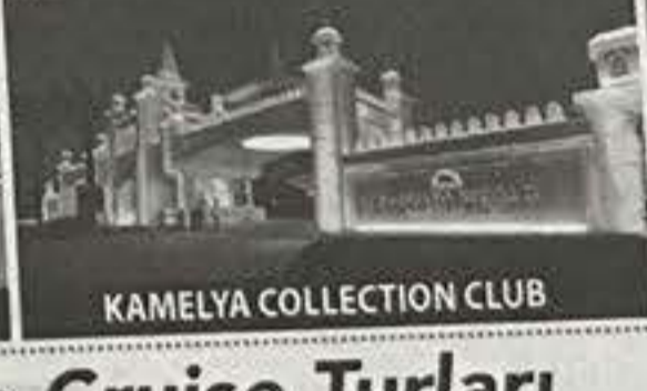
KAMELYA COLLECTION CLUB