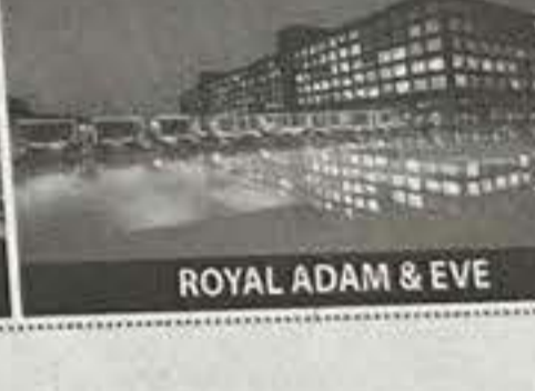
ROYAL ADAM &amp; EVE