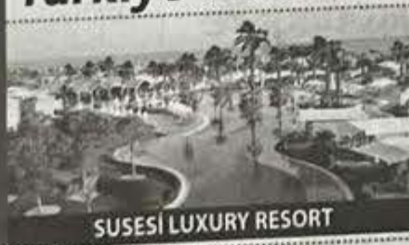
SUSESİ LUXURY RESORT