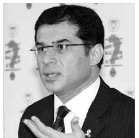
Κατά τα άλλα θέλει λύση και η Αγκυρα και ο Ερογλου... Μ.Φρ.

Αντί να δει την κατακραυγή που προκάλεσε η κυνική, προκλητική και αλαζονική δήλωση Μπαγιά για προσάρτηση των κατεχομένων στην Τουρκία, ο λεγόμενος υπουργός εξωτερικών του ψευδοκράτους μιλά για διαστρέβλωση κι επικρίνει όσους τα είπαν ένα κεράκι στον Τούρκο διαπραγματευτή.