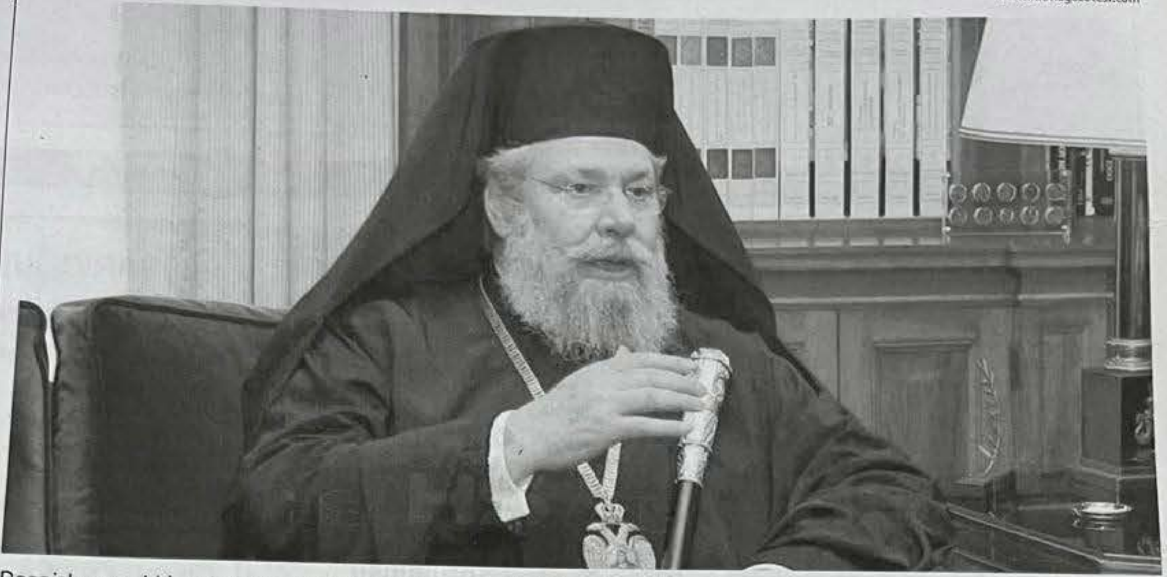
Başpiskopos Hrisostomos, ırkçı yorumlarını sürdürdü ve "TC kökenliler 100 yıl sonra bile Avrupalı olamaz" dedi