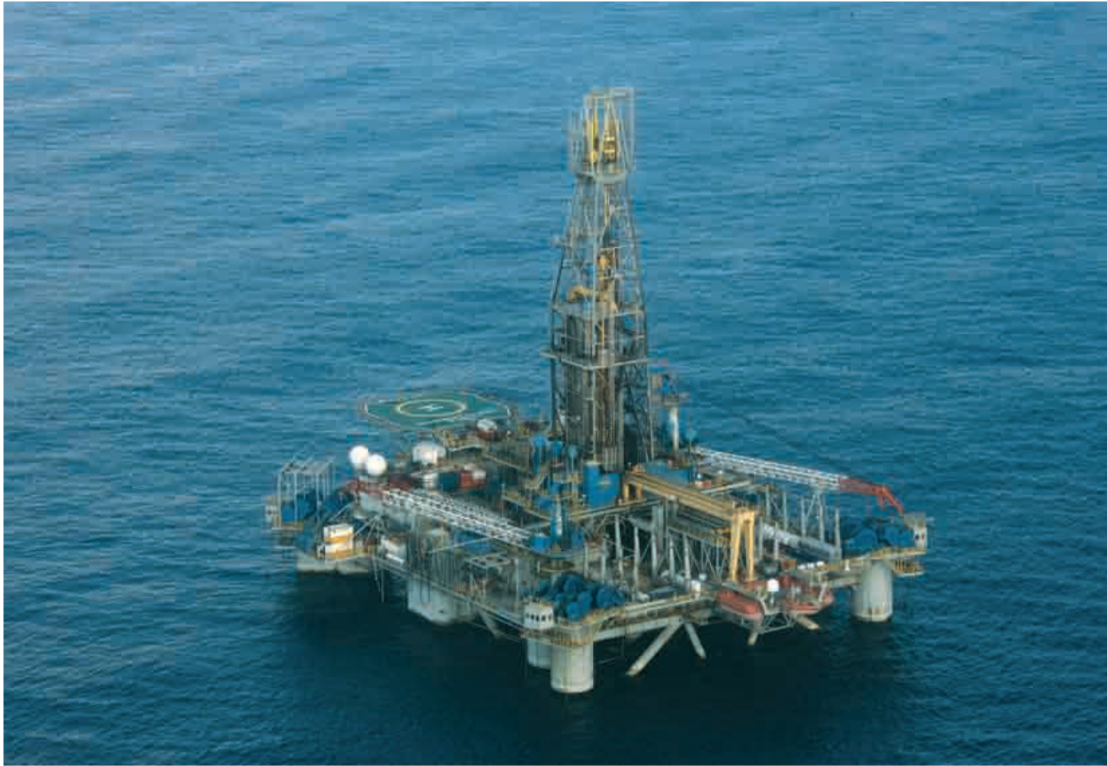
Εκθεση του "International crisis group" εισηγείται διαμοιρασμό των κοιτασμάτων

Το μεγαλύτερο κέντρο μελετών στον κόσμο εισηγείται διαμοιρασμό των κοιτασμάτων, άρση των απειλών της Τουρκίας και προσφυγή σε διεθνές δικαστήριο για επίλυση των διαφορών