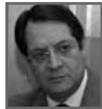
Νίκος Αναστασιάδης Πρόεδρος ΔΗΣΥ