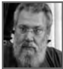
Χρυσόστομος Β' Αρχιεπίσκοπος

«Στην ψεσινή συνεδρία δεν τέθηκε από κανένα μέλος του Εκτελεστικού Γραφείου θέμα αποχώρησης του ΔΗΚΟ από την Κυβέρνηση». Ποιος αφήνει την πίτα που το μέλι; Αμα λείπει το μέλι, μάλιστα!