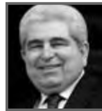
Δημήτρης Χριστόφιας Πρόεδρος Δημοκρατίας

«Θυμηθείτε ότι δεν χρειάζονται τα πάντα για να απολαύσετε τη ζωή, χρειάζεται όμως ζωή για να απολαύσετε τα πάντα». Θυμηθείτε ότι χρειάζεται μόνο μια ωραία δόλωση για να πάρετε βέλος πάνω από το Βαρόμετρο!