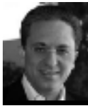
Του Νίκου Τορναρίτη*

Ο ι διαπραγματεύσεις για το Κυπριακό στο Greentree εισέρχονται σε κρίσιμη φάση. Ο ΓΓ του ΟΗΕ Μπαν Γκιμουν κάνει λόγο για "το τέλος του παιχνιδιού", αλλά το Προεδρικό δεν είναι σε θέση να εκτιμήσει ποια τροπή θα πάρει η διαδικασία. Σε αυτό το θολό τοπίο είναι πολύ δύσκολο να εκτιμήσει κανείς αν η πλευρά μας μπορεί να βγει κερδοσμένη ή αν θα χρεωθεί και ευθύνη για την αποτυχία.